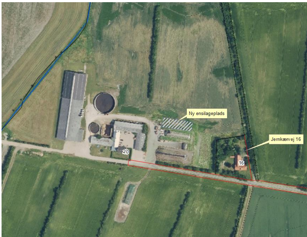
Kort 1: Placering af ensilagesilo og eksisterende bygninger

Placeringen af det ansøgte i forhold til bedriftens eksisterende bygninger fremgår af kort 1.